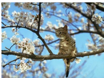
Kotki na drzewach...